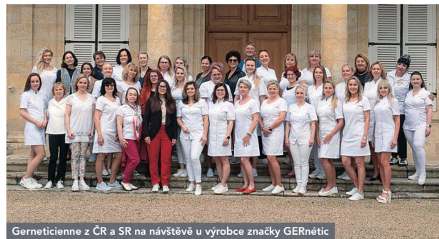
Gerneticienne z ČR a SR na návštěvě u výrobce značky GERnétic

Profese zdravotní sestry je často původním zaměřením našich spolupracujících kosmetiček. Kosmetičkami se stanou nejčastěji absolventkami rekvalifikačních kurzů nebo kosmetických škol. Pak nastane ideální čas k přihlášení se na Vstupní odborný seminář GERnétic. Dále svou práci nová kosmetička může vylepšit a posunout na vyšší úroveň využíváním všech ateliérů a příležitostí k procvičování různých typů ošetření. Velmi také pomáhá a motivuje zapojení do komunity Gerneticienne.